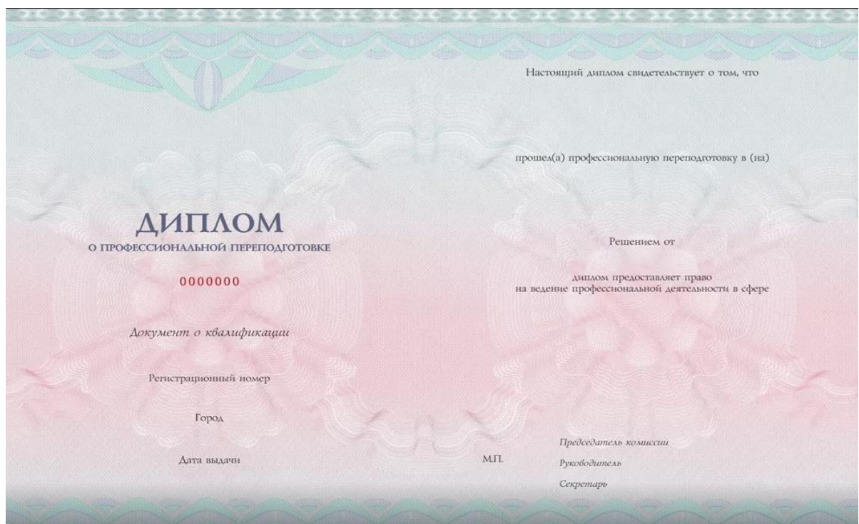
Рис. 2. Обратная сторона бланка диплома о профессиональной переподготовке