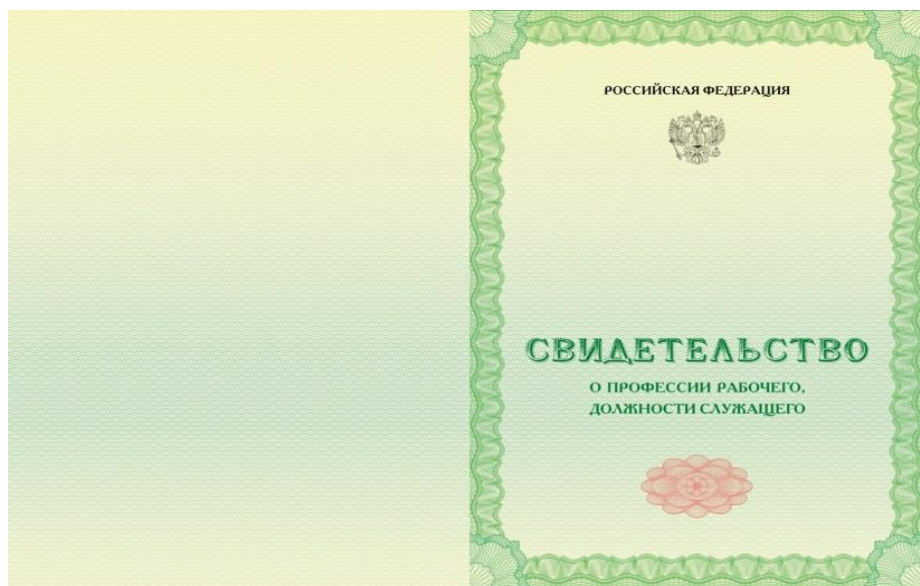
Рис. 1. Лицевая сторона бланка свидетельства о профессии рабочего, должности служащего