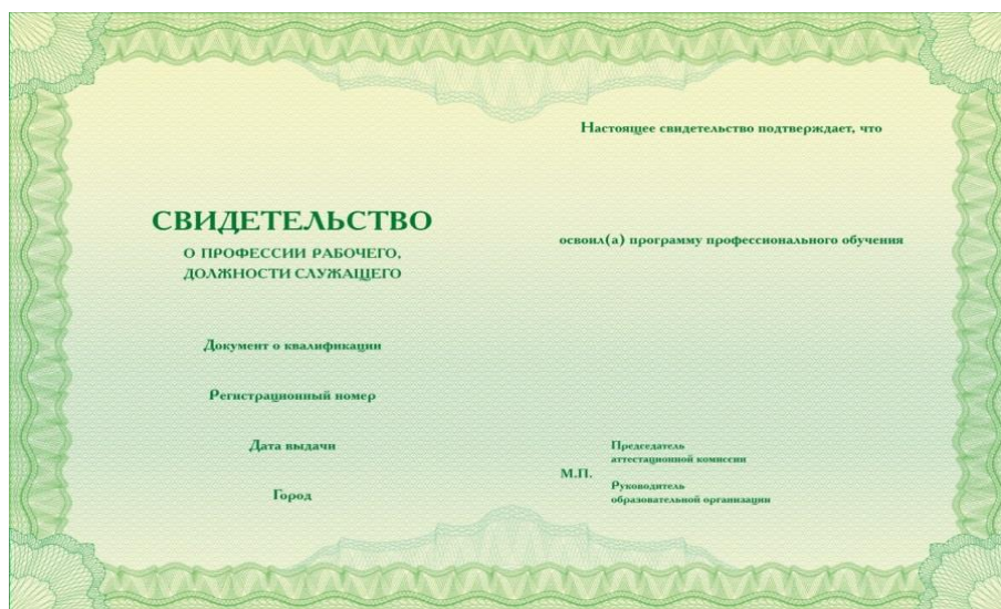
Рис. 2. Обратная сторона бланка свидетельства о профессии рабочего, должности служащего