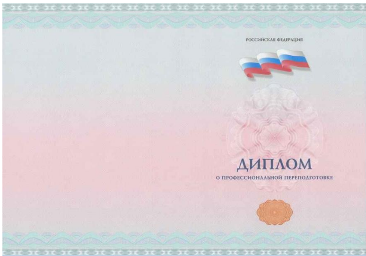
Рис. 1. Лицевая сторона бланка диплома о профессиональной переподготовке