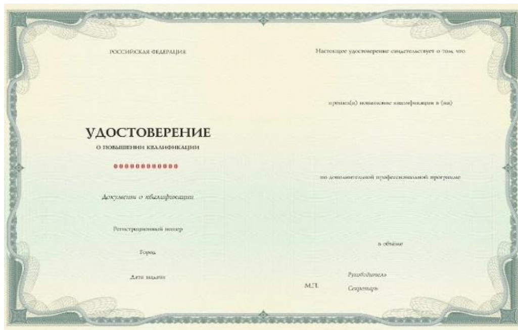
Рис. 2. Обратная сторона бланка удостоверения о повышении квалификации